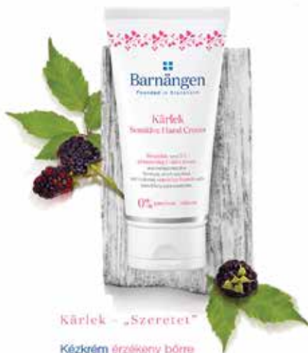
Kärlek – „Szeretet”