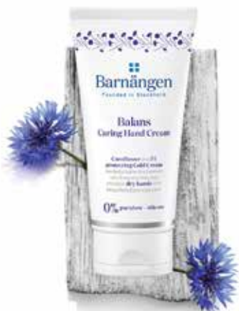
Balans – „Kiegyensúlyozottság”