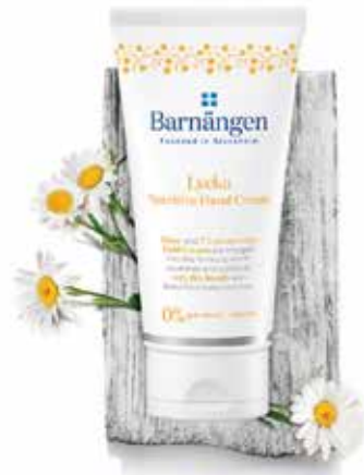
Lycka – „Boldogság”